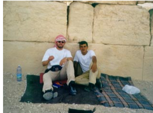
Tedrikning med beduinerne i Palmyra

uger som en af de bedste og mest anderledes oplevelser, jeg har haft. Det gælder både det faglige aspekt og samværet med de mennesker, der var tilknyttet ekspeditionen. At opleve denne del af verden har været helt fantastisk, og lokalbefolkningen var meget venlige og