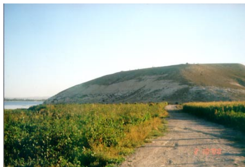
Højen der blev opmålt

gende. På de varmeste tidspunkter på dagen var temperaturen omkring 40 grader. Efter at formiddagens arbejde var overstået, blev der sædvanligvis holdt siesta et par timer. Herefter kunne resten af dagen og aftenen gå med at beregne de data, som jeg og min flittige hjælper, Kenan, havde indhentet om formiddagen. Derudover skulle der selvfølgelig også være tid til kortspil og almindelig socialt samvær.